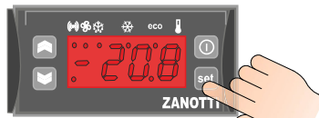
Wybieranie nastawy temperatury

Naciśnij przycisk set Zostanie wyświetlona aktualna nastawa. (Aby zmienić nastawę temperatury ponownie naciśnij set)