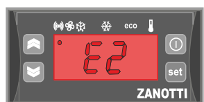
Alarm uszkodzonego czujnika ciśnienia

UWAGA !!! JEŚLI KILKUKROTNA OPERACJA RESETOWANIA AUTOMATYCZNEGO NIE SPOWODUJE ZNIKNIĘCIA BŁĘDU STEROWNIK AUTOMATYCZNIE UNIERUCHOMI AGREGAT CELEM UNIKNIĘCIA JEGO USZKODZENIA, W TAKIEJ SYTUACJI PROSIMY O WYŁĄCZENIE AGREGATU I NIEZWŁOCZNY KONTAKT Z NAJBLIŻSZYM SERWISEM ZANOTTI