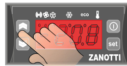
Zmiana nastawy temperatury

Po wyświetleniu wartości nastawy używając przycisków UP/DOWN zmień wartość (zatwierdzenie nastawy następuje po 15 sekundach)