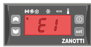
Alarm uszkodzonego czujnika temperatury

W WIĘKSZOŚCI WYPADKÓW KASOWANIE ALARMÓW ODBYWA SIĘ AUTOMATYCZNIE POPRZEC RESET AUTOMATYCZNY POLEGAJĄCY NA WYŁĄCZANIU I PONOWNYM WŁĄCZENIU AGREGATU. W CELU WYCISZENIA ALARMU DŹWIĘKOWEGO NALEŻY WCISNĄĆ DOWOLNY PRZYCISK.