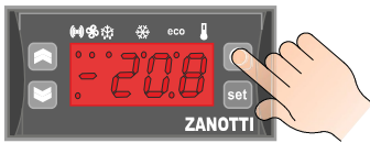
Włączanie / Wyłączanie agregatu

Wciśnij i przytrzymaj przez 3 sekundy przycisk On/OFF (podczas włączania miganie wyświetlacza informuje o pracy sterownika w trybie testy)